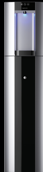
Zilver – Vloeropstelling