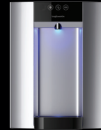
Zilver – Aanrechtmodel