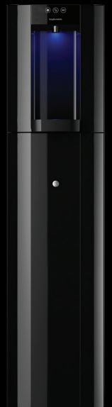
Zwart – Vloeropstelling