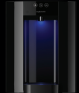
Zwart – Aanrechtmodel